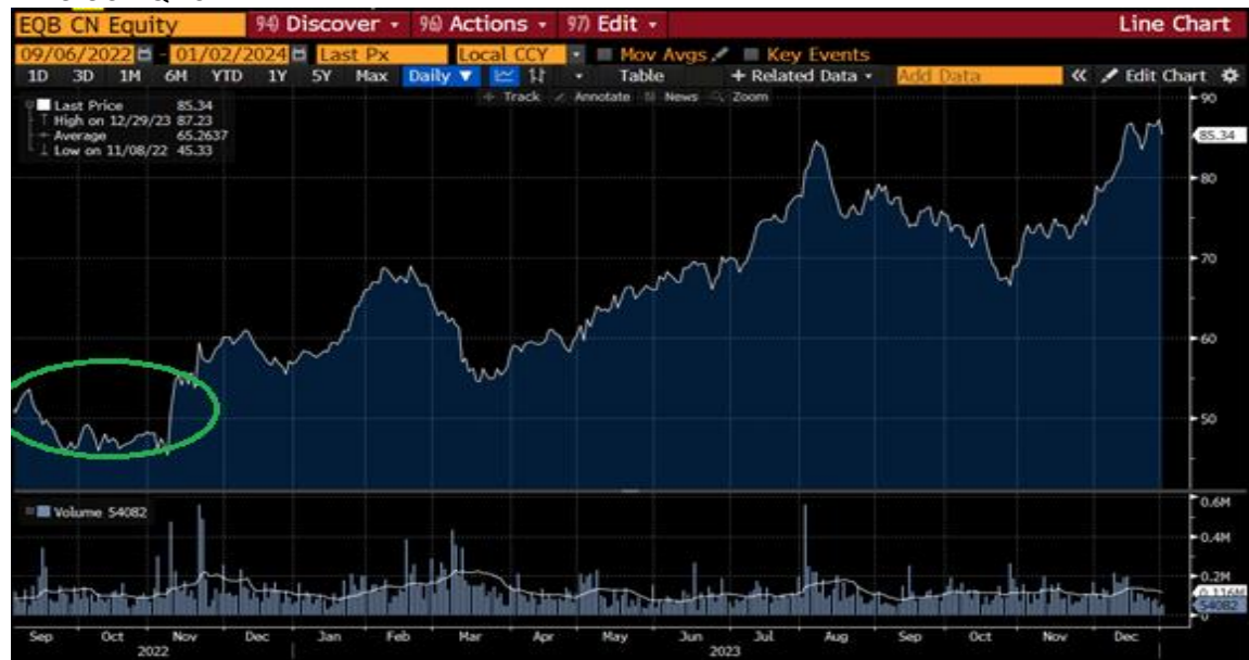
Annexe 3: EQB CN

En septembre 2022, notre estimation de la valeur intrinsèque de EQB était d'environ 95 $ par action. Nous avons également établi un niveau de prix d'action minimum justifié, un niveau auquel le prix de l'action est susceptible de revenir rapidement (les irrationalités excessives pour cette entreprise durent rarement longtemps), à 72 $ par action. À ce moment-là, l'entreprise se négociait à 51 $ par action, soit à peine 0,7 fois la valeur comptable (P/B) et 5,1 fois le bénéfice par action (P/E) pour l'exercice 2023.